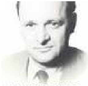
Nagrada "Grigor Vitez"